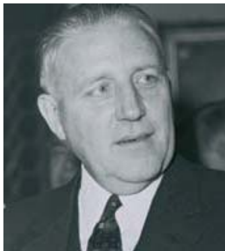
Пьер Вернер, премьер-министр Люксембурга

После Второй мировой войны государства Европы для достижения финансовой стабильности присоединились к системе Бреттон-Вудса, в рамках которой курсы национальных валют были зафиксированы в отношении доллара США.