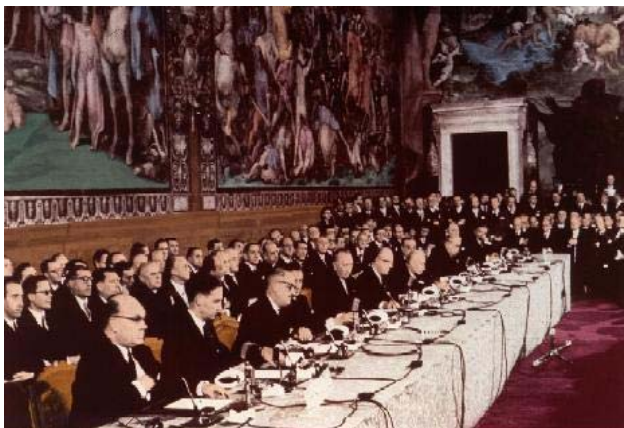
Подписание Римского Договора, 1957 г.

25 марта 1957 года с целью углубления экономической интеграции те же 6 государств в Риме подписали договор о создании Европейского экономического сообщества (European Economic Community, EEC) и Европейского сообщества по атомной энергии (European Atomic Energy Community, Euratom). Европейское экономическое сообщество было создано в первую очередь как таможенный союз шести государств, призванный обеспечить свободу перемещения товаров, услуг, капиталов и людей. Европейское сообщество по атомной энергии должно было способствовать объединению мирных ядерных ресурсов этих государств. Дата подписания Римского Договора 25 марта 1957 года считается днём основания современного Европейского Союза.