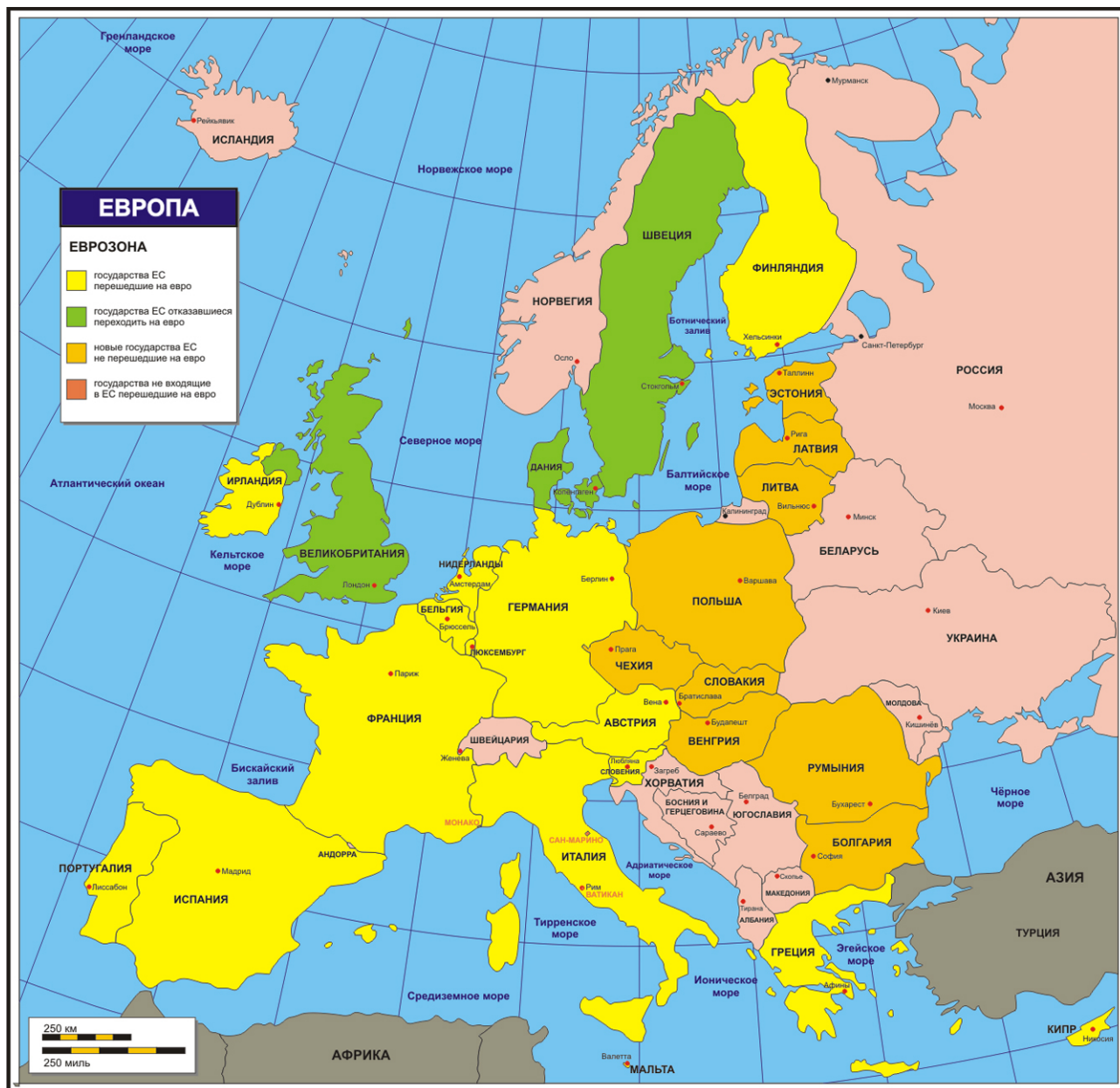
Карта. Зона обращения евро