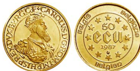
30-летие подписания Римского Договора, Бельгия, 50 ЭКЮ, 1987 г., золото 0.900, 17.28 г, тираж - 1 532 000 шт.

Объем эмиссии ЭКЮ также определялся на расчётной основе. Выпуск этой единицы осуществлялся посредством зачисления выраженных в ней сумм на специальные счета. ЭКЮ не имела материальной формы в виде банкнот или монет, она являлась записанной валютой. Однако в 1987 году в ознаменование 30-летия подписания Римского Договора бельгийское казначейство выпустило ограниченное количество юбилейных монет для коллекционеров с номиналами, выраженными в европейской валютной единице: золотые 50 ЭКЮ и серебряные 5 ЭКЮ.