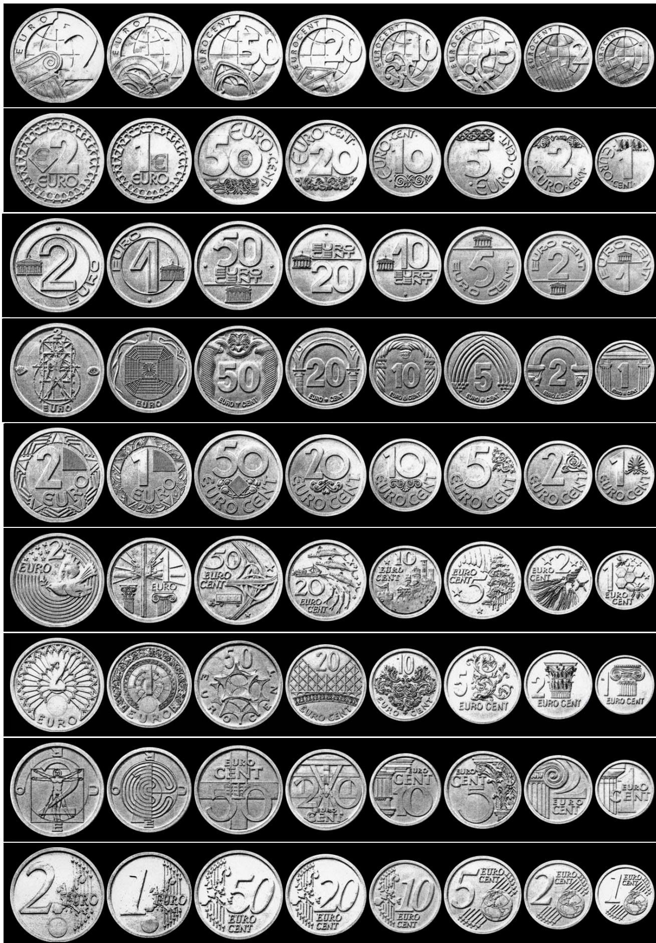
Таблица 1. Проекты оформления монет евро, отобранные экспертами Европейской Комиссии