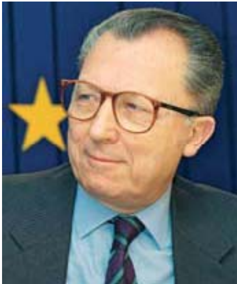
Жак Делор, президент Европейской Комиссии с 1985 по 1995 гг.