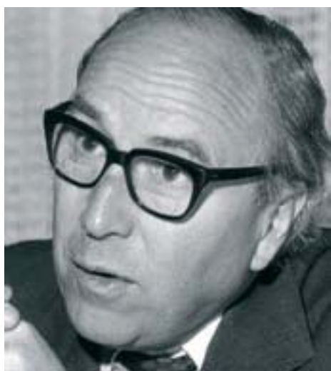
Рой Дженкинс, президент Европейской Комиссии с 1977 по 1981 гг.

В 1977 году президент Европейской Комиссии Рой Дженкинс внёс предложение о создании Европейской валютной системы (European Monetary System, EMS).