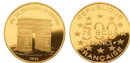
Франция, 75 ЭКЮ / 500 франков, 1993 г., золото 0.920, 17.00 г, тираж - 5 000 шт.

В последующие годы монетные дворы практически всех европейских государств и других государств, в том числе и не имеющих отношения к Европейской валютной системе, выпустили множество монет с номиналами, выраженными в ЭКЮ. Однако все они были выпущены исключительно в коллекционных целях, практического применения как наличные деньги не имели и относятся к так называемым «unusual coins» (необычные или неофициальные монеты).